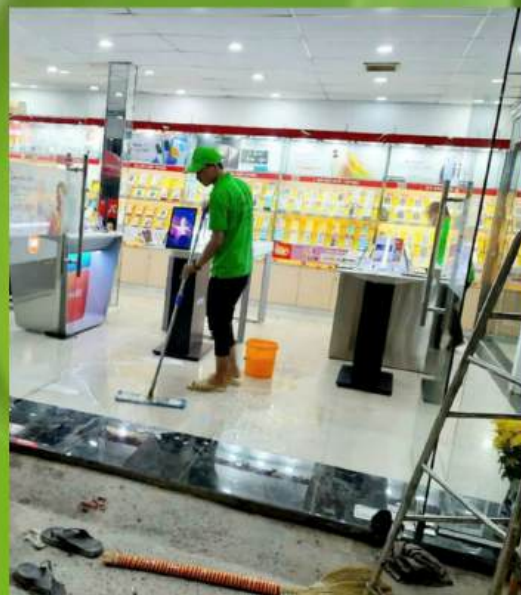
Cửa hàng, cơ sở kinh doanh