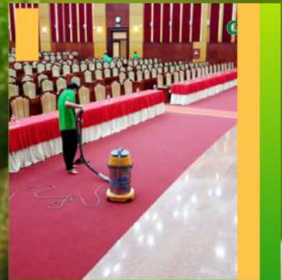
UBND tỉnh Bình Dương