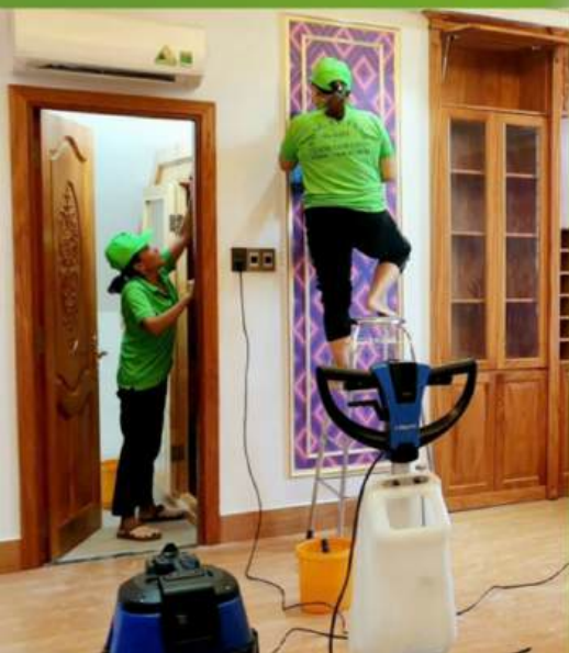
Tổng vệ sinh căn hộ

Tổng vệ sinh nhà xưởng và văn phòng công ty