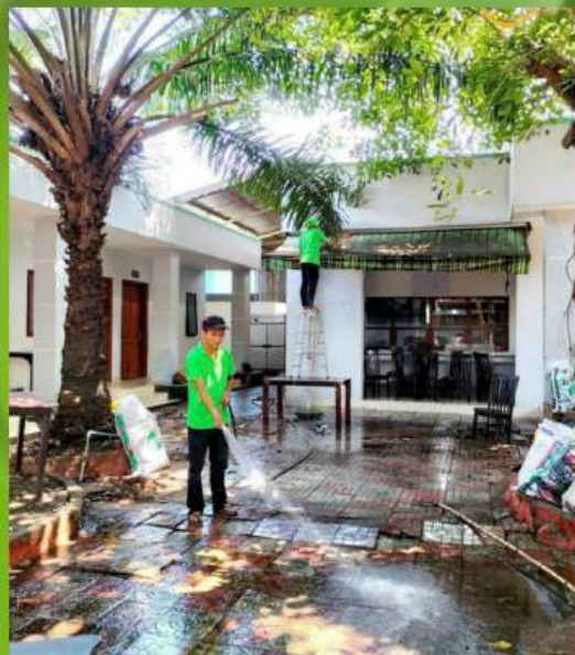
TVS cửa hàng, cơ sở kinh doanh