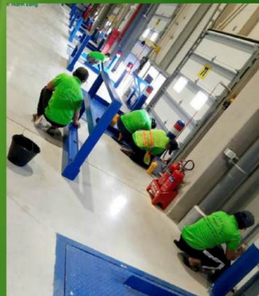
TVS nhà xưởng và VP công ty