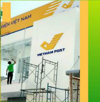
Viet nam Post