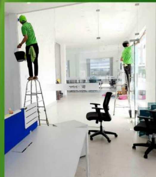
Nhà xưởng và VP công ty