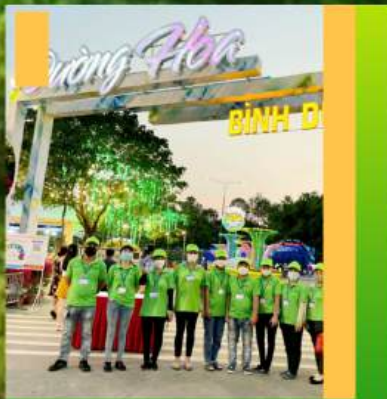
Hội hoa xuân Bình Dương