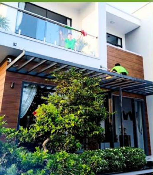
Căn hộ, nhà ở

Nhà xưởng và văn phòng công ty vừa hoàn thiện