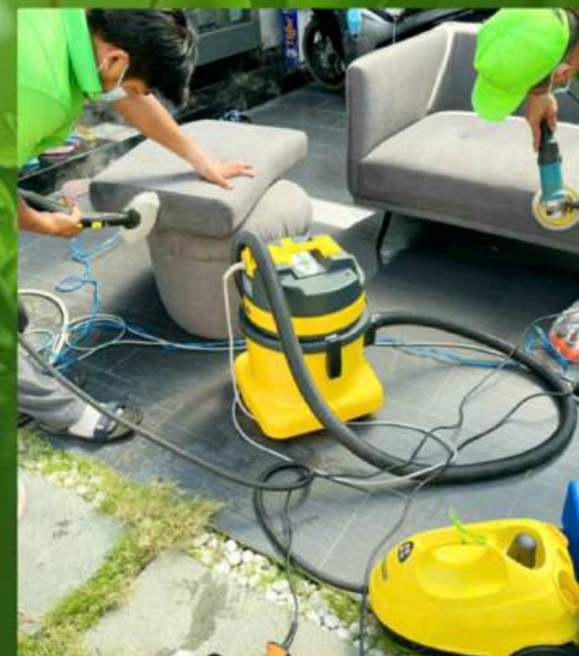
Giặt ghế sofa