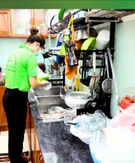
Giúp việc nhà

Giúp việc theo giờ nhà ở, cửa hàng kinh doanh Tạp vụ văn phòng, cơ quan, tổ chức